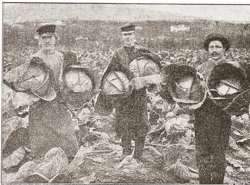
Hufvdkål, Vesternorrlands-, se nästa sida.

Kål som odlades i de första kålgårdarna fröodlades säkert och den traditionen kan ha levt kvar vilket kan ha betydelse för sortutbudet. Hemmaodling förekom troligen även senare och man hade sina egna sorter. Det finns därför inte så mycket sorter i början av perioden och dessa är oftast tyska eller danska. Men kommersiell fröodling ökar, främst för vitkål. Detta gör också att svenska sortnamn dyker upp. Kanske är dessa varianter av en tidigare svensk typ av vitkål. Det namn som först fanns med är 'Kinnekulle'.