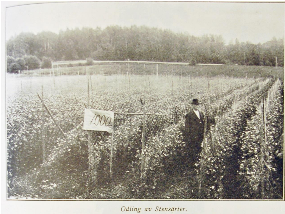
Bild 5. Fröodling av 'Stensärt' för Örebro frö- frukt och blomsterhandel på 1920-talet. Från priskurant 1927. Finns på Kungliga biblioteket, Sveriges nationalbibliotek.

Sorten har också vanligen svenskproducerad frö. Enligt Svensson (2004) fanns den i frökatalogerna fram till 1964. Många som lämnade in mörkarter till Fröuppropet (se kap. 7) kallade dem för stensärter.