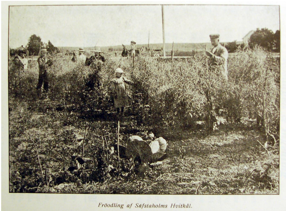
Bild 8. Fröodling av 'Säfstadholm' för Örebro frö- frukt och blomsterhandel på 1920 talet. Från priskurant 1927.

Det finns många olika "heirloom seed catalogue" på nätet. Ibland kan dessa innehålla sorter som det också står ursprung på. Men att hitta ett sätt att systematiskt leta igenom dessa kataloger är inte lätt. Många av sorter med nordiskt ursprung har också redan hamnat inom föreningen Sesam som delvis gjort genomsökningar i dessa kataloger.