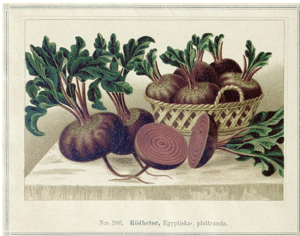
N:o 206. Rödbetor, Egyptiska-, plattrunda.

Även för rödbetor är det ibland svårt att avgöra när det är en beskrivning och när det faktiskt är sortnamn. Tre typer finns; långa, halvlånga och runda och namnen blir ofta sammansatt med företag eller Ortsnamn som 'Dippes svartröda runda'. Ibland tappar man bort företagsnamnet och det är svårt då att veta när det är samma sort som avses. 'Egyptisk plattrund' ('Egyptisk rund') är ett namn som ständigt återkommer. Varför den kallas egyptiskt finns inte förklarat. Troligen är det bara en formbeskrivning och till att börja med inte sortnamn alls. Sorten dominerar helt tillsammans med 'Holländska blodröda'.