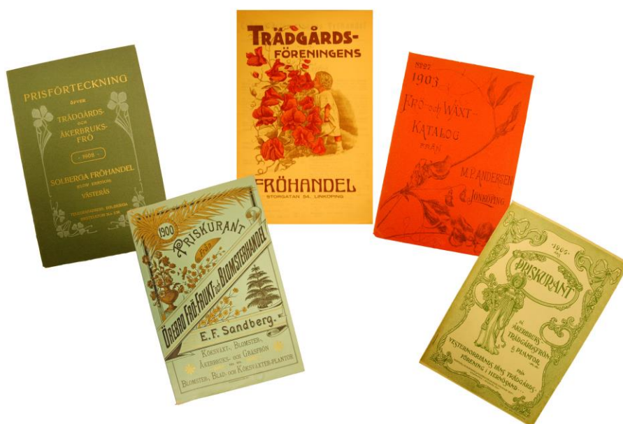
Bild 1. Priskuranterna har ofta fantastiska och varierande framsidor. Dessa kataloger finns på Kungliga biblioteket, Sveriges nationalbibliotek.

Två sammanställningar har gjorts. Den första är en lista över de priskuranter från 1800-talet till 1930 som finns på Kungliga biblioteket (bilaga 1). Det finns drygt 400 olika firmor varav mer än hälften har priskuranter avseende frö av köksväxter. Dessa frökataloger, tillsammans med andra källor, står sedan som grund för den andra listan som är en förteckning över sorter (bilaga 2) som fanns under perioden.